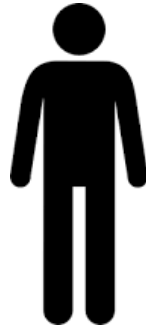
Sviðsstjóri C yfirmaður skjalastjóra