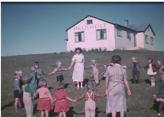
Úr kvikmynd Eðvarðs Sigurgeirssonar um Pálmholt

geymd á safninu síðan 1979, en var í eigu Kvenfélagsins Hlífar, sem stofnsetti barnaheimilið, og var henni skilað inn á safnið ásamt öðrum gögnum kvenfélagsins það ár. Kvikmyndasafn Íslands tók DVD afrit sem notað var á sýningunni með góðfúslegu leyfi Egils Eðvarðssonar, sem fer með höfundarrétt yfir efni föður síns. Sýningin stóð frá 7.- 30. júní.