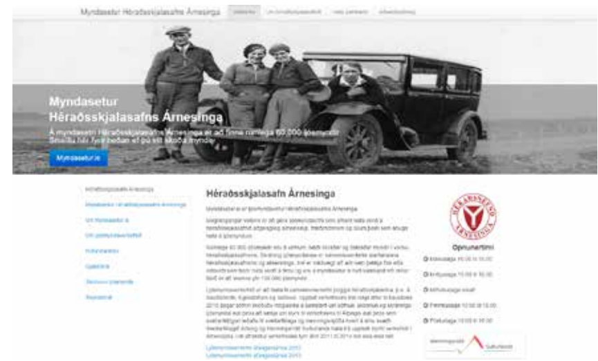
Myndasetur.is, forsiða vefsins. Óhætt er að fullyrða að aðsókn að vefnum hefur farið fram úr björtustu vonum. Flettingar á vefnum skipta þúsundum dag hvern.