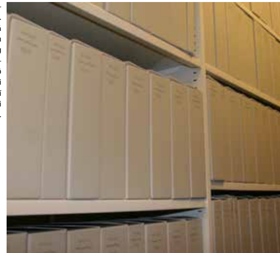
Í einni af skjalageymslum safnsins. KLUG öskjur frá Þýskalandi eru núna notaðar og mikið vinna framundan við að umpakka eldri afhendingum í viðeigandi umbúðir.

Eins og áður eru stærstu afhendingarnar frá skilaskyldum aðilum – um helmingur af fjölda afhendinga, en ef horft er til fjölda hillumetra þá er hlutfallið yfir 90% af samanlögðum hillumetraffjölda. Meginreglan er sú að starfsmenn héraðsskjalasafnsins aðstoða skilaskylda aðila með margvíslegum hætti skv. nánara samkomulagi hverju sinni. Í mörgum tilfellum ná starfsmenn skjalasafnsins í skjölin, skrá, flokka og ganga frá þeim í geymslur. Þessa vinnu greiða sveitarfélögin sérstaklega fyrir. Þetta fyrirkomulag styrkir sambandið á milli sveitarfélaganna og skjalasafnsins og mun nýtast enn betur í framtíðinni þegar skjalasafnið fer að sinna lögbundnu eftirliti.