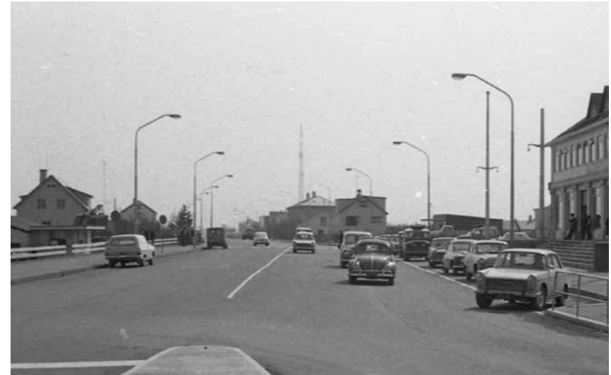
Austurvegur á Selfossi. Núpur, Gamli bankinn, Kaupfélagshúsið, Hlaðir, Landsbankinn o.fl. hús. Stór hluti af þessari götumynd er ekki lengur til staðar. 2010/45 TJ 02732.