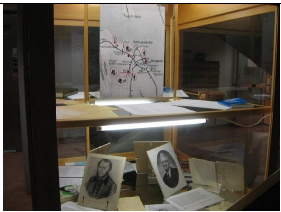
Sýning um vesturfara úr Dalvíkurbyggð

Skrá um einkaskjalasöfn var unnin í samvinnu við Þjóðskjalasafn og samkvæmt forskrift þeirra. Skráin er sameiginleg skrá alls landsins og verður aðgengileg á netinu og sú vinna sem nú var unnin er því upphafið að stærri gagnagrunni. Að þessu sinni voru skráð í gagnagrunninn 75 einkaskjalasöfn sem varðveitt eru á safninu og fleiri bíða eftir að bætast við.