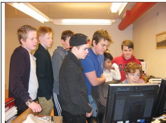
Nemendur í 8 - 10 bekk í kennslustund