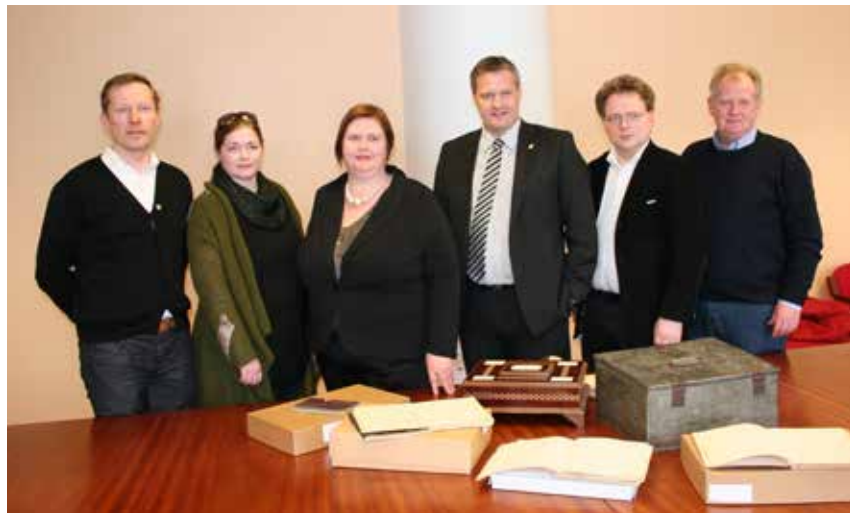
Á blaðamanna- fundi 18. apríl í húsaáskynnum Borgarskjalasafns Reykjavíkur þar sem átaki ÍSl og Félags héraðs- skjalavörða á Íslandi var hleypt af stokkunum.