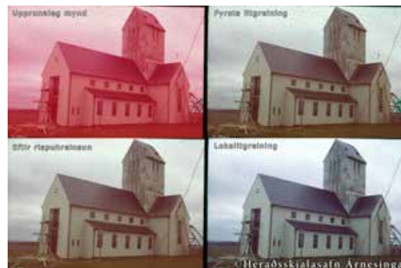
Skálholtskirkja. Upprunaleg mynd efst til vinstri, fyrsta litgreining efst til hægri, rispuhreinsun neðst til vinstri og loka litgreining neðst til hægri.

Mikið hefur verið rætt um aðgengi almennings og sveitarfélaga að ljósmyndum á skjalasafninu. Í samstarfi við Sveitarfélagið Árborg voru hönnuð átta ljósmynda-skilti, 130x150 sm. sem sett voru upp í miðbæ Selfoss og á íþróttasvæði bæjarins fyrir UnglingalandsmótUMFÍ sem fram fór í bænum sumarið 2012. Á skiltunum var brugðið upp svipmyndum úr bæjarlífinu, af Ölfusárbrú, árflóðunum, veiði í ánni, Mjólkurbú Flóamanna, Kaupfélagi Árnesinga og íþróttalífi í bænum.